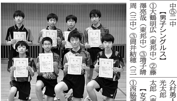
男子シングルス個人戦ベスト8