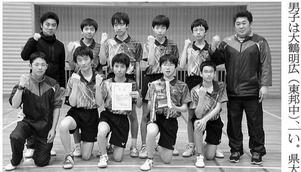
男子団体戦優勝の東邦中

8チームが参加し、2コ ートにわかれリーグ戦を行 った。コート1位同士による 決勝戦で香澄シーガルスが 優勝を飾った。 大会結果は次の通り。 ▽Aコートリーグ戦 Kan 2 21 14 dK 2 21 14 野ならし 2 21 17 MKC 2 21 17 Kan 2 21 17 dK 2 21 14 野ならし 1 21 14 MKC 2 21 17 Kan 2 21 14 dK 2 21 14 野ならし 1 21 14 MKC 2 21 17