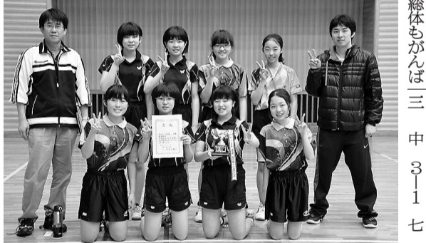
女子団体戦優勝の四中