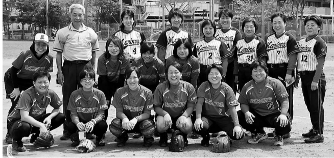
一般女子の部優勝のしらとと習志野と習志野マリンス