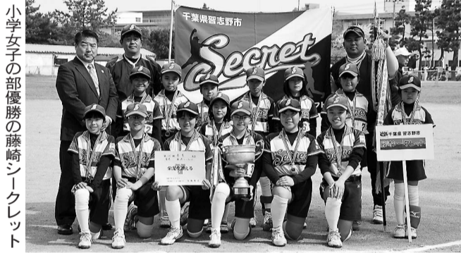
小学女子の部優勝の藤崎シークレット

と習志野と習志野マリンスとの試合が行われた。小学女子の部は4チームがリーグ戦に参加し、全勝の藤崎シークレットが優勝を果たした。