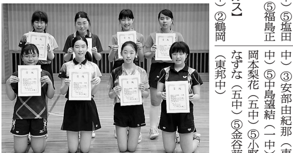
女子シングルス個人戦ベスト8