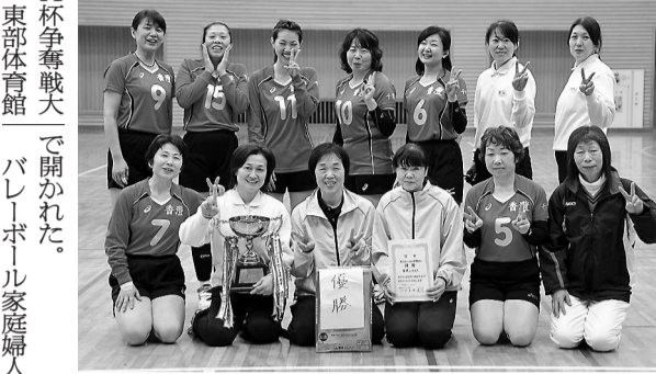
優勝の香澄シーガルス

8チームが参加し、2コ ートにわかれリーグ戦を行 った。コート1位同士による 決勝戦で香澄シーガルスが 優勝を飾った。 大会結果は次の通り。 ▽Aコートリーグ戦 Kan 2 21 14 dK 2 21 14 野ならし 2 21 17 MKC 2 21 17 Kan 2 21 17 dK 2 21 14 野ならし 1 21 14 MKC 2 21 17 Kan 2 21 14 dK 2 21 14 野ならし 1 21 14 MKC 2 21 17