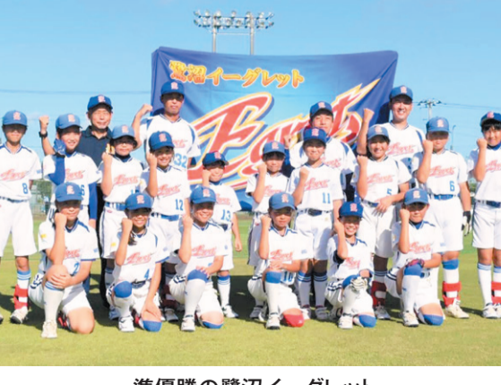
準優勝の鷺沼イーグレット

第31回千葉県小学生男女ソフトボール選手権大会の女子の部が8月30日、東金市民スポーツ広場で開かれた。 3チームずつ2組による予選と1位同士による決勝戦が行われた。習志野市から出場した鷺沼イーグレットは第1試合、萱田ピュアジャム(八千代市)に4-1で勝利。続く第2試合は海神ジュニアスターズ(船橋市)と対戦。8-2と快勝し、決勝戦に進出した。 決勝戦はミルキーエンジェルズ(茂原市)との顔合わせとなった。鷺沼も健闘するが、1-6で敗れ、準優勝となった。