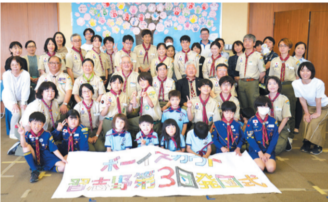
ボーイスカウト習志野第3団発団式

日本ボーイスカウト習志野第1団と第2団は統合し、4月1日から「日本ボーイスカウト習志野第3団」として新しいスタート切った。 ボーイスカウト習志野第1団は1967(昭和42)年4月に発団、第1期生はスカウト24名が入団し、ボーイスカウト4班が発足し、活動を開始した。その後、加盟員が増加。ボーイスカウト習志野第2団は1982(昭和57)年11月、15周年を迎えた第1団から分封し