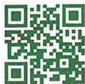
HP QR コード